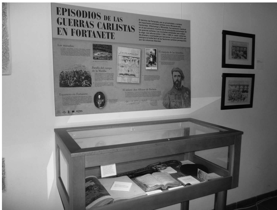
Panel de Fortanete en la Exposición Tiempos convulsos en el Maestrazgo