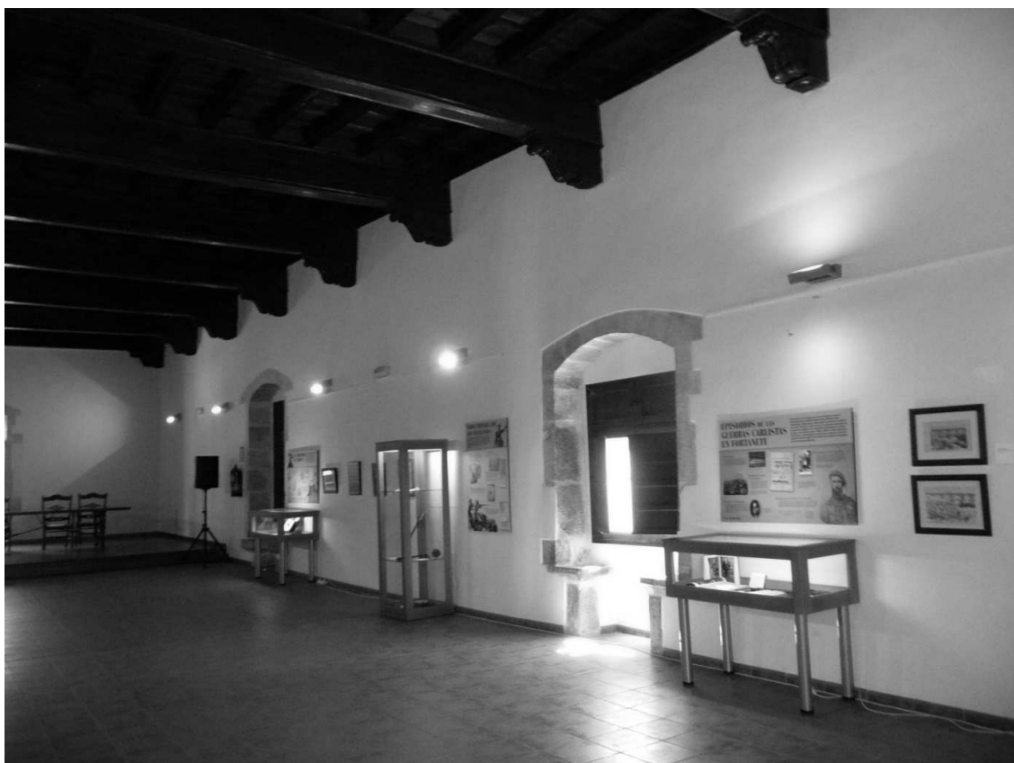
Parte de los paneles, vitrinas y láminas expuestos en el salón del Ayuntamiento